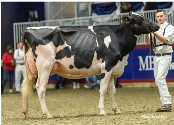
DANDYLAND ATEAM LALA DAUGHTER